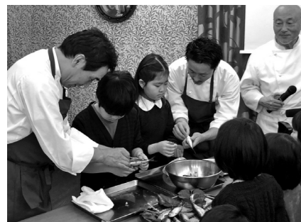
2019年 八戸ブイヤベース with 栃木

一般社団法人美食都市研究会による美食都市アワードは、地域独自の美食文化の魅力や、食を軸としたまちづくりの取り組みを評価・表彰する日本初のアワードです。2024年に創設され第3回となる今年は、地域固有の文化と食の魅力を活かし、新しい文化やビジネスを生み出し、国内外から観光客を惹きつけ、その地方都市の価値を高めることに成功した都市として、余市町(北海道)、八戸市(青森県)、飛騨市(岐阜県)、日田市(大分県)が選定されました。