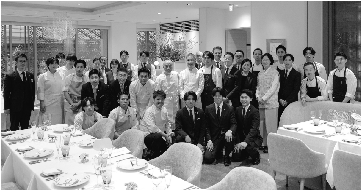
L'Orangerie 光庵 / THE KITANO HOTEL TOKYO

世界中の優れたホテルやレストランが加盟するルレ・エ・シャトー。トップクオリティのサービスを提供することはもちろん、その土地とのつながり、自然環境保全のための取組を重視し、地球規模で未来のためのガストロノミーを追求しています。そのルレ・エ・シャトーに加盟する「ザ・キタノホテル東京」と「オトワレストラン」のコラボレーションディナーが開催されました。