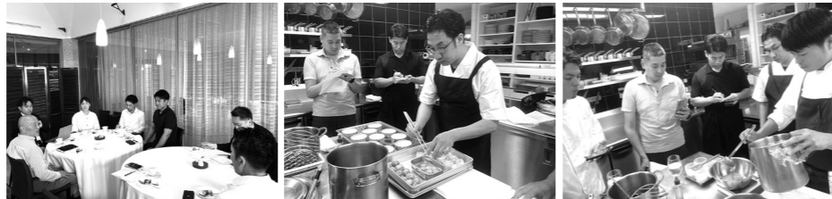
サービス勉強会 (2026年5月14日)

栃木県の食材を生かした高品質の料理、サービスを提供するレストランによる「とちぎおもてなしレストラン協議会」は、2026年2月より活動を開始しました。初年度は9軒のレストランの加盟が認証され、ホームページやパンフレットの準備が整ってきました。5月に開催した加盟店向けの勉強会では、調理技術やサービスの向上に向けて学び合いの機会を設けました。