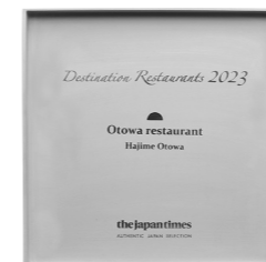
オトワレストラン 音羽元シェフは Destination Restaurants 2023 を受賞